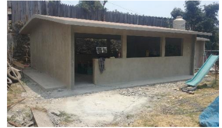
Mejoramiento del jardín de niños Patamburo