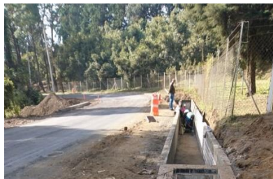
Alcantarilla pluvial camino Tancítaro-Infonavit