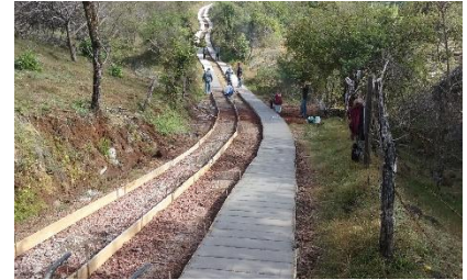
Pavimentación de la calle de acceso a la comunidad La Coronita