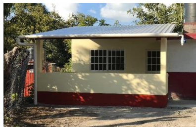
Construcción de comedor escolar Pancinda