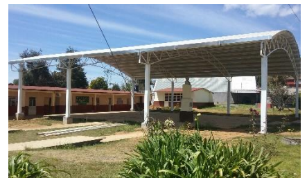
Construcción de techumbre en la escuela primaria Zirimbo