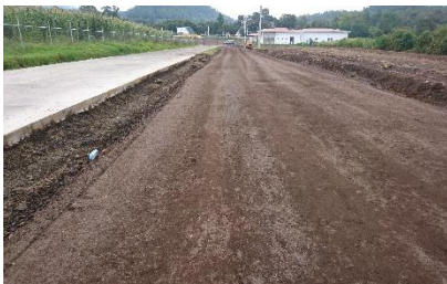
Pavimentación de calle de acceso al hospital CESSA, segunda etapa Tancitaro