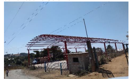
Construcción de techumbre en la cancha de basquetbol primera etapa El Jacal