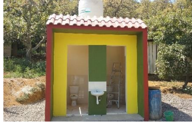
Rehabilitación del jardín de niños La alberca