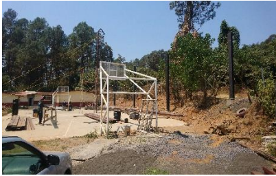
Construcción de techumbre en la cancha de la escuela primaria Aguachepe