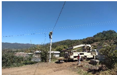
Ampliación eléctrica trifásica 1 era etapa Aguacate Poniente