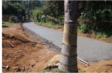
Pavimentación de calle principal La Alberca