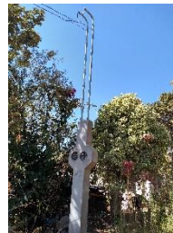
Ampliación de red eléctrica El Zapote