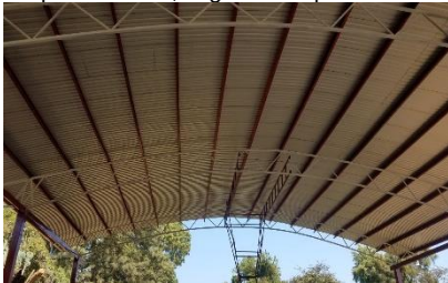
Construcción de techumbre 1 etapa de la cancha publica Púcuaro