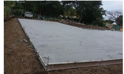
Cancha de voleibol El Caracol

Se continúa trabajando y gestionando para atender las necesidades del municipio para brindarles un mejor servicio en los diferentes rubros: Salud, Agua Potable y Alcantarillado, Educación, Alimentación, Electrificación y Alumbrado Público y Urbanización.