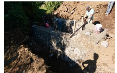
Rehabilitación de drenaje sanitario y pluvial calle independencia Tancítaro