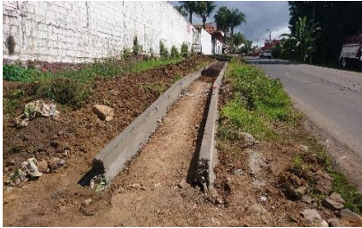
Construcción de un andador Choritiro