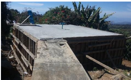
Construcción de depósito El Chirimoyo