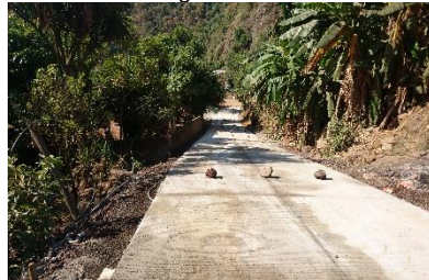
Pavimentación de la calle principal El Cortijo