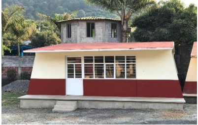
Construcción de un aula en la escuela primaria El Cuate