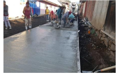
Rehabilitación de drenaje pluvial con recubrimiento de concreto calle Juárez Tancítaro