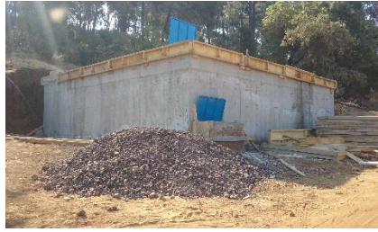
Construcción de depósito de agua potable Apúndaro