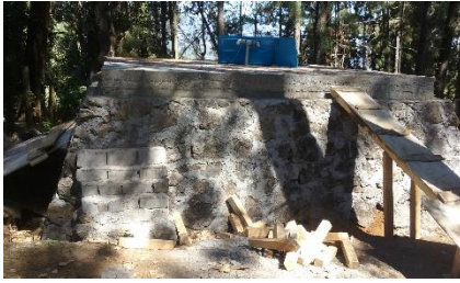
Sistema de agua potable 1ra etapa La Mora