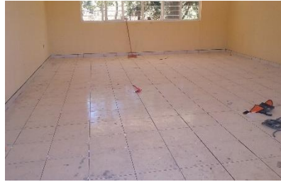
Terminación de 2 aulas en el Telebachillerato Apo del Rosario