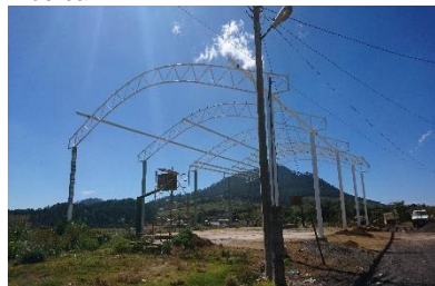
Construcción de techumbre con gradas, en la colonia magisterial Tancitaro