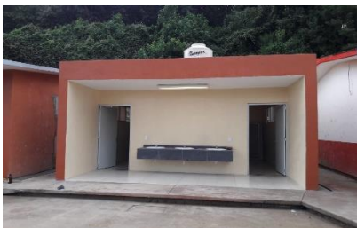
Construcción de módulo de sanitarios en la escuela primaria Choritiro