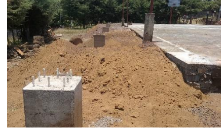
Construcción de techumbre en la cancha de la escuela primaria El Pinabete